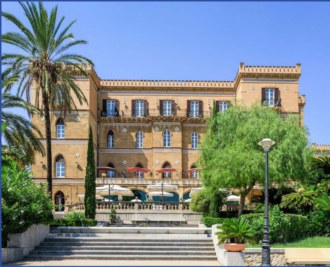
Grand Hotel Villa Igia